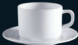
SET CAFÉ / TÉ