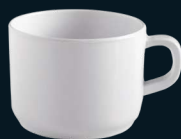
POCILLO TÉ / CAFÉ