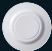
PLATO TÉ / CAFÉ