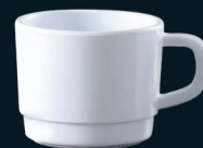
POCILLO TÉ / CAFÉ